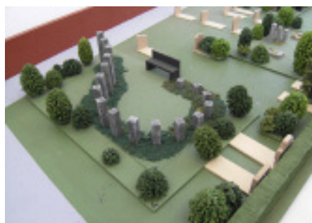
Modellstudie für Urnenbeisetzungen