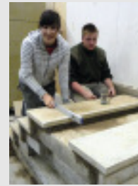
◀ Verlegung von Treppenbelägen