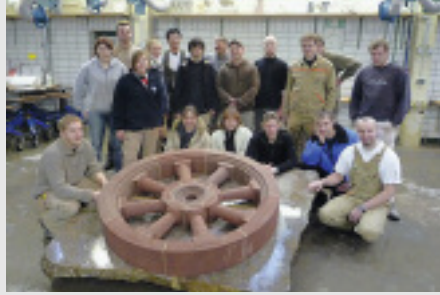
◀ ▲ Grundtechnik Steinprofilierung