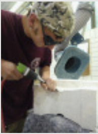
◀ Steinbearbeitung mit Druckluft