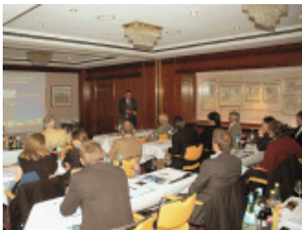
Das Interesse war erfreulich groß.

hier laufen die Informationen der Technischen Beratung, von Seminaren, Informationen der bauchemischen Industrie und den Fachzeitschriften zusammen.