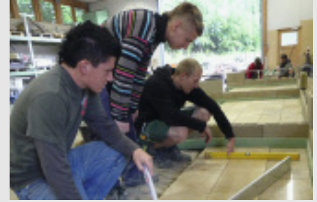
▲ Verlegung von Bodenbelägen