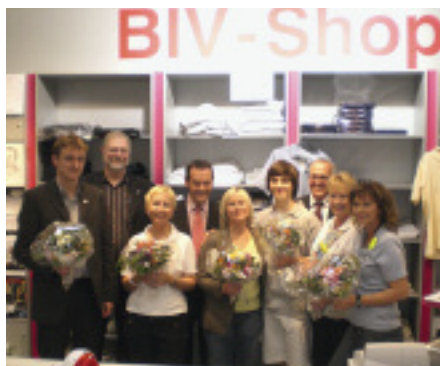
Vielen Dank für Ihren Besuch! Ihr BIV-Team

Der BIV als Spitzenvereinigung der Steinmetzbetriebe in Deutschland vertritt die Interessen von etwa 2 800 Mitgliedsbetrieben gegenüber allen relevanten Behörden und Institutionen sowie der Öffentlichkeit auf nationaler und europäischer Ebene. Dies ist eine ideelle Darstellungsweise und eine Zusammenfassung der Aufgaben in ganz kurzer Form. Doch wer steckt dahinter, wer füllt das alles mit Leben? Auf der einen Seite sind das die Mitarbeiter des BIV mit ihren ganz spezifischen Aufgaben. Auf der anderen Seite sind das die Mitglieder, die Ehrenamtsträger, Obermeister, Landesinnungsmeister, Vorstände, Lehrlingswarte etc. Dies ist der bedeutungsvollere Teil. Diese Menschen engagieren sich für ein starkes Steinmetzhandwerk. Jeden Tag, Jahr um Jahr und mittlerweile seit 60 Jahren. Dies haben wir