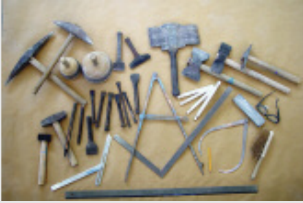
▲ Steinbearbeitung von Hand