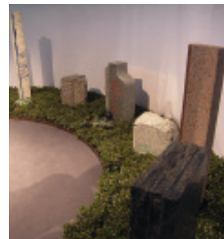
Konzeptpräsentation zur Sonderschau

allen Nähten, als vor rund 280 Vertreter von Kommunen und rund 90 Branchenkenner Günter Czasny das Konzept zur Grabstättengestaltung der Zukunft vorstellte.