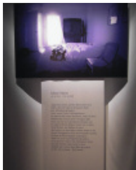
Gegenüberstellung einer individuellen Wohnraumsituation und einer individuell gestalteten Grabstätte

Diese Veranstaltung übertraf hinsichtlich der Teilnehmerzahl und der Resonanz alle Erwartungen. Der Vortraum platzte aus