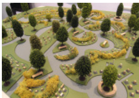
Modellsituation einer Flächenplanung

»Jetzt«, so unser BIM, »müssen wir an das Umsetzen gehen«.