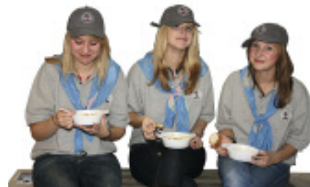
Goldene Zukunft: Gemeinsam löffeln hier die Steinmetzinnen von morgen ihre Suppe aus.

Fachleute. Die Messe stellte den Steinmetzen die Standfläche kostenlos zur Verfügung. Die Steinmetzbetriebe brachten je 700 € »Startgeld« und im Schnitt drei Arbeitstage für die Ausstellung auf. Das Berufsbildungswerk und der LIV Niedersachsen steuerten je 1 000 € bei. Sponsoren waren zudem die Firmen J. König (Technik), Möller-Chemie (Steinreinigung, -schutz und -pflege), Rossittis (Naturwerksteine und Caesar Stone) sowie Tringenstein (Grabmale). Die Veranstaltung kann anderen Innungen als Anregung dienen. Axel Peinemann und seine Kollegen können sich vorstellen, die vorhandenen Stellwände, Infotafeln, Prospektvorlagen etc. bundesweit an Kollegen zu verleihen, samt Know-how. Interes-