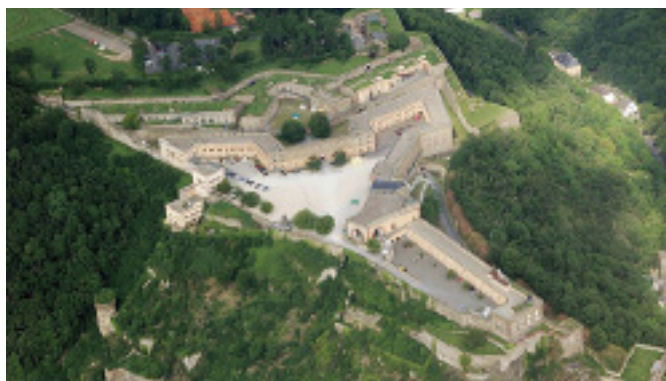
Die Festung Ehrenbreitstein, die durch die neue Seilbahn mit dem Stadtzentrum verbunden wird.

Auch die gezielte Information der Besucher durch geschulte Berater soll fortgeführt werden. In Schwerin waren ausgewählte Steinmetzmeister vor Ort, die über alle Bereiche der Grabmalgestaltung Auskunft geben konnten. Für diese Tätigkeit werden noch geeignete Personen gesucht, für Vorschläge sind wir offen und dankbar.