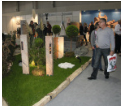
Die Ausstellung war ansprechend gestaltet und zeigte eindrucksvoll, was man alles aus Naturstein machen kann.